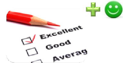
Efficacia e tempi di risposta dell'assistenza clienti