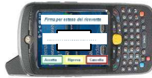
Firma sul palmare