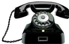
Assistenza Clienti con documentazione cartacea