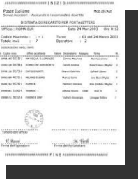
Modello da compilare a mano