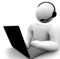
Assistenza Clienti con documentazione in digitale