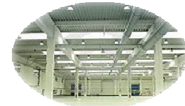
Spazi sui centri