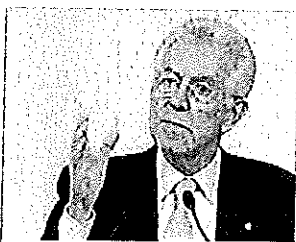
Mario Monti

Emendamento del governo al dl Milleproroghe: l'aumento del prezzo finanziario alcune modifiche alla riforma previdenziale